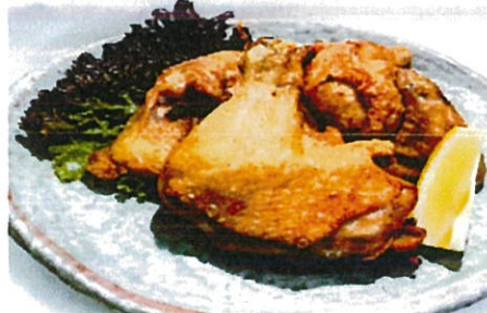
若鶏半身唐揚げ 880円