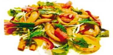
オニオンサラダ 480円