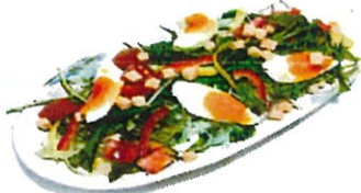
シーザーサラダ 550円

串盛りセット (5本入り) 750円 ぶた串 (1本) 180円 とり串 (1本) 160円 つくね串 (1本) 190円 手羽串 (1本) 240円