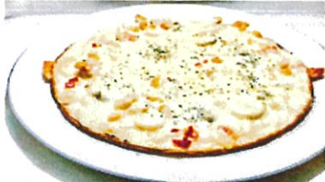
シーフードピザ 980円