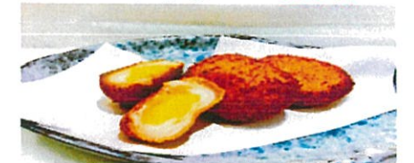
チーズじゃがもち 330円