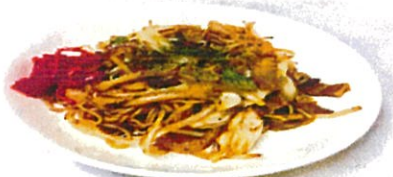
貝だくさん焼きそば 480円